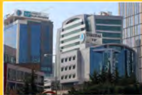
15 Mart 2018 Perşembe T.C. Üsküdar Üniversitesi Tıp Fakültesinin Kuruluşu