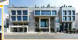
3 Mart 2011 Perşembe Davranış Bilimleri ve Sağlık Alanında Türkiye'nin İlk Tematik Üniversitesi T.C. Üsküdar Üniversitesinin Açılışı