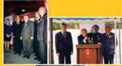
27 Ekim 2000 Cuma Memory Centers of America adına, Memory Center of İstanbul Tarafından 9. Cumhurbaşkanı Sn. Süleyman Demirel'e Güçlü Hafıza Ödülü ve Nöropsikiyatriye Katkı Ödülleri Töreni