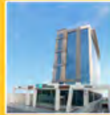
17 Ağustos 2016 Çarşamba NPİSTANBUL Beyin Hastanesi Açıldı