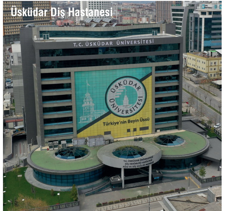
Üsküdar Dış Hastanesi