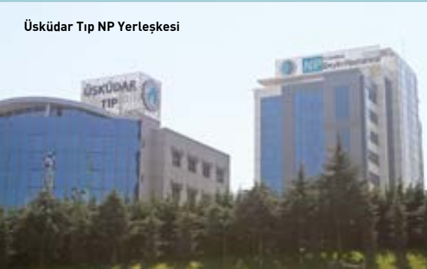
Üsküdar Tıp NP Yerleşkesi