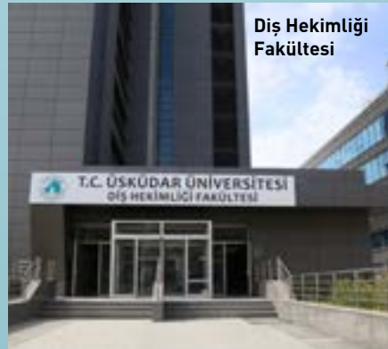
Diş Hekimliği Fakültesi